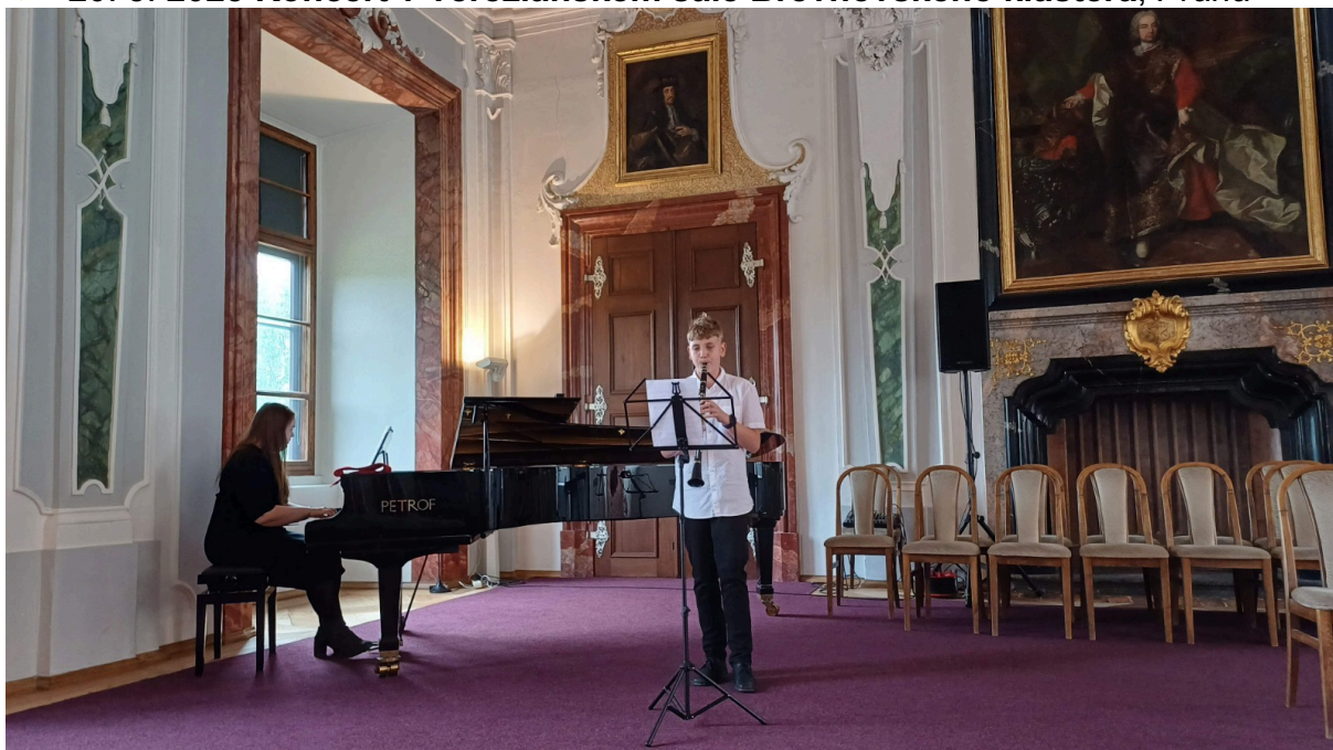
▼ 20. 5. 2025 Koncert v Tereziánském sále Břevnovského klášteřa, Praha