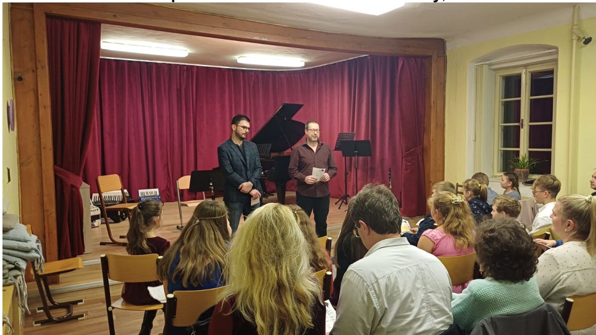
▼ 1. 12. 2024 Zahájení adventu v Březnici, náměstí Březnice