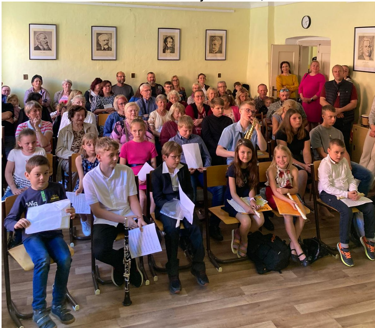
▶ 19. 5. 2025 Den s Dvořákem – společný koncert ZUŠ okresu Příbram, Divadlo Příbram