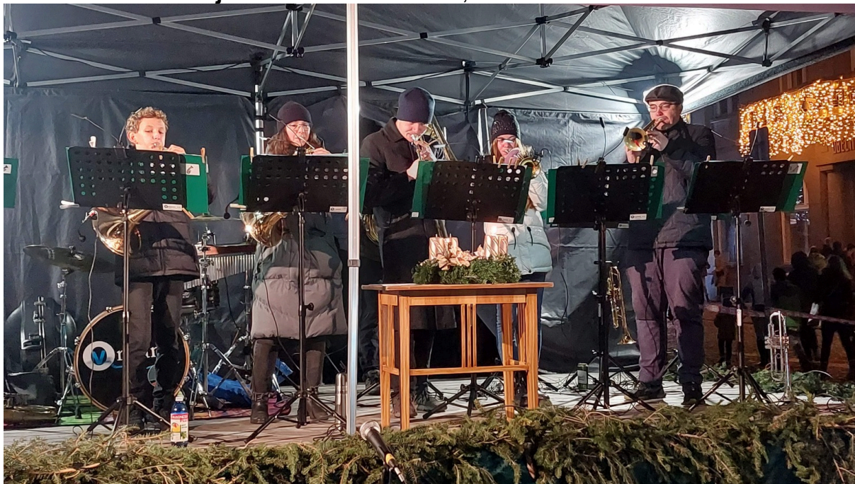
▶ 1. 12. 2024 Zahájení adventu v Drahenicích, u vánočního stromu