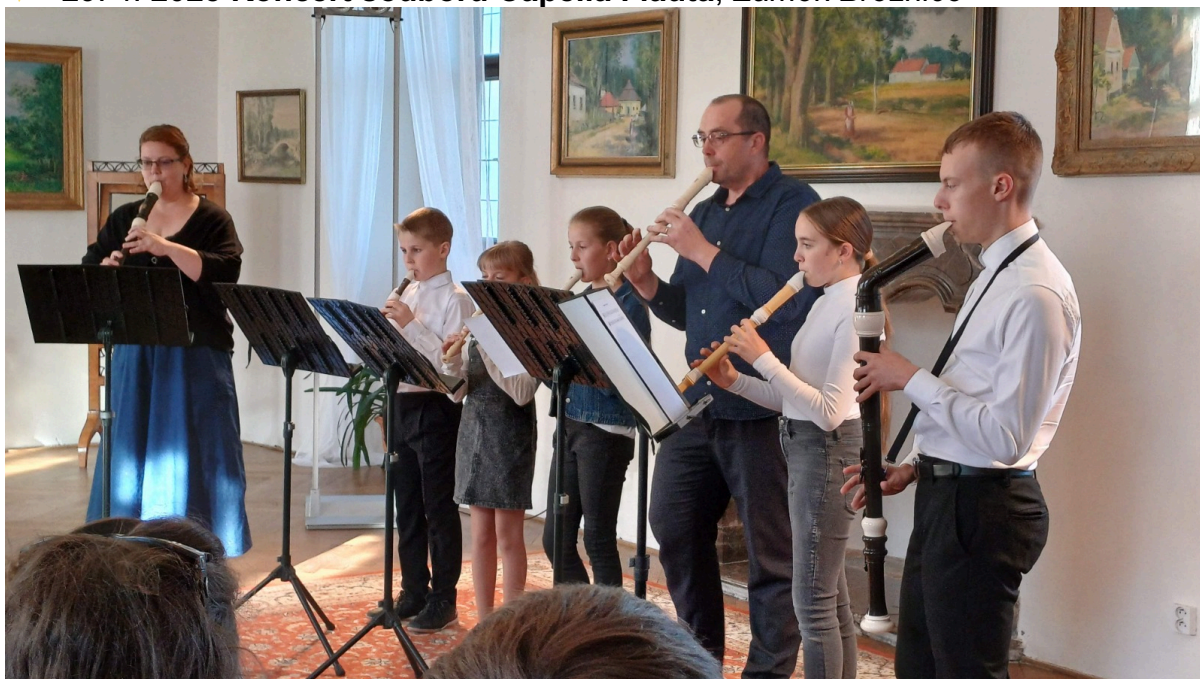
▶ 30. 4. 2025 Příjímací zkoušky, sál ZUŠ Březnice